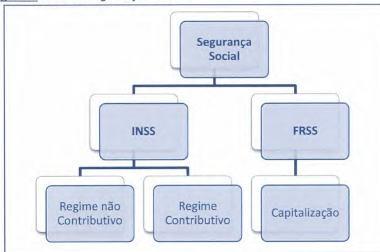
Figura 1: Setor da Segurança Social

A construção do Sistema de Segurança Social foi, porém, sendo feita de forma faseada, ao longo da última década.