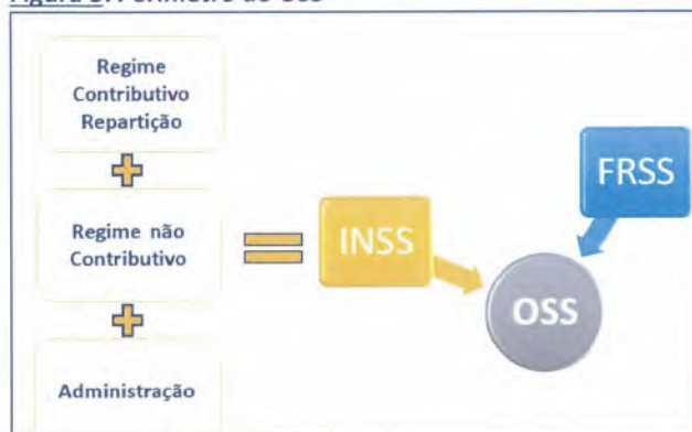
Figura 3: Perímetro do OSS

A construção do OSS, integrando estas componentes, foi sendo feita, desde 2017, de forma gradual, e atendendo às circunstâncias em cada ano, como foi relatado nos Relatórios dos anos 2017 e 2018. O ano 2019 foi o primeiro ano em que o OSS já integrou, no respetivo perímetro, todas as componentes, embora o FRSS não se encontre, ainda, constituído.